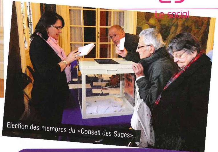
Election des membres du «Conseil des Sages».