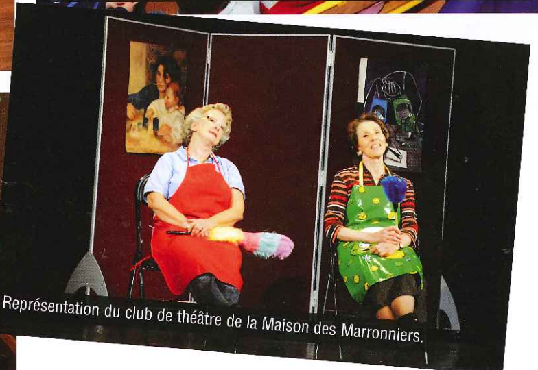
Représentation du club de théâtre de la Maison des Marronniers.