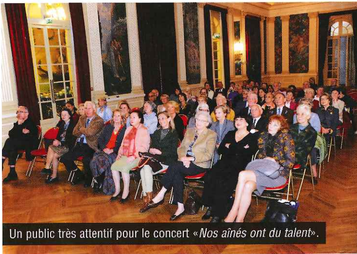
Un public très attentif pour le concert «Nos aînés ont du talent».