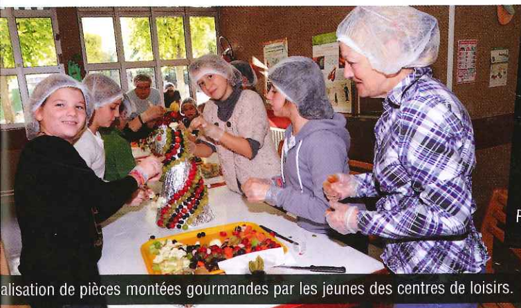
Réalisation de pièces montées gourmandes par les jeunes des centres de loisirs.