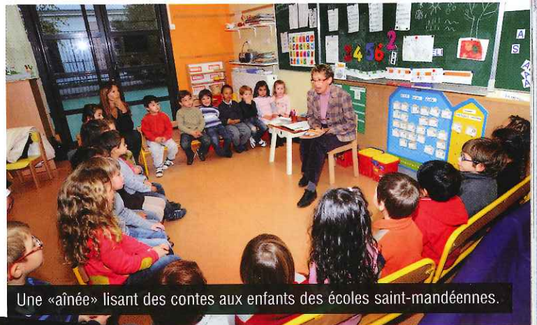
Une «aînée» lisant des contes aux enfants des écoles saint-mandéennes.