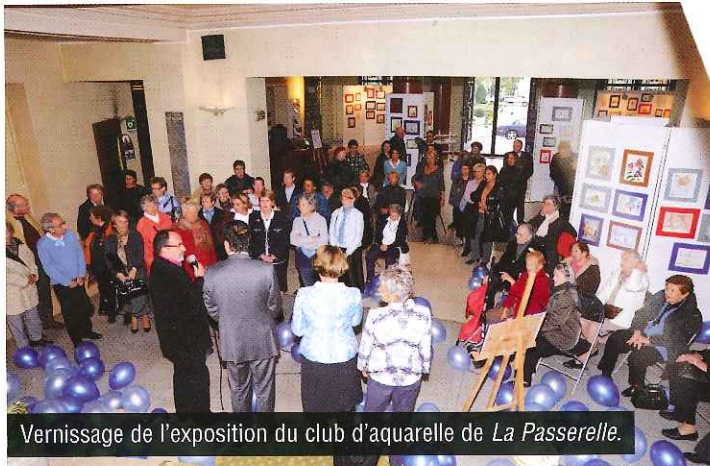
Vernissage de l'exposition du club d'aquarelle de La Passerelle.