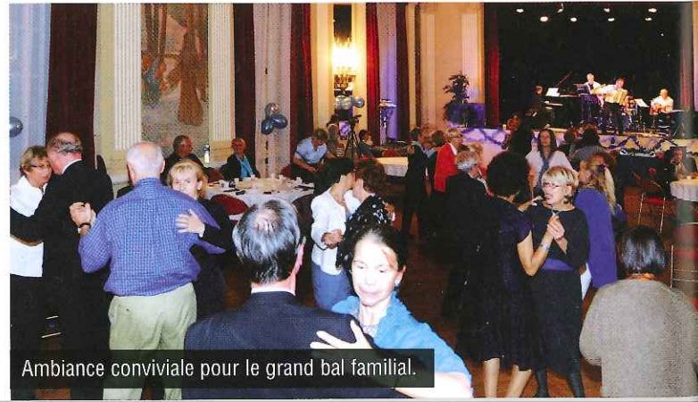
Ambiance conviviale pour le grand bal familial.